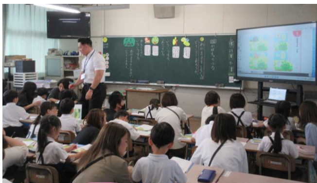
1年生道徳「かぼちゃのつる」 わがまをしないってどういうことかな

また、佐賀県全体の道徳の取組として「ふれあい道徳」があります。学校・家庭・地域が連携した道徳教育を推進するために、年に1回は必ず保護者の皆様が参観できる道徳の授業を行うこととしています。ぜひ、ご家庭でも授業の様子について話題にさせていただけると学校と家庭とが同じ目線で道徳教育を進めることができると思います。